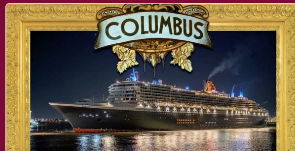
Grüße von der Nordsee